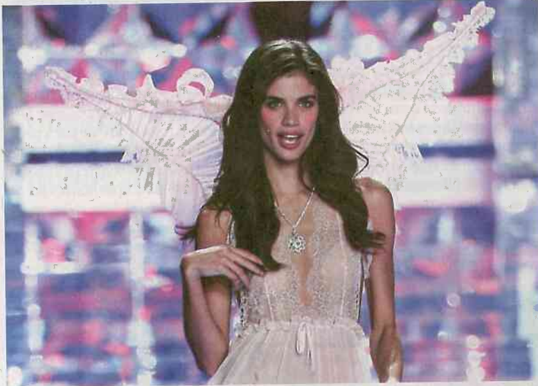
Modelo portuguesa Sara Sampaio é um dos novos 'anjos' da Victoria's Secret